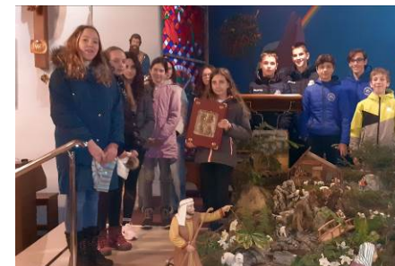
Birmanci se pripravljajo na branje Božje Besede

Čas se je dopolnil. Čas, ki ga je napovedal Bog že v raju, ko je obljubil, da bo ženin zarod strl kači glavo; čas, napovedan Abrahamu, da bodo po njem blagoslovljeni vsi rodovi; čas, ko bo vzcvetela Jesejeva mladika; čas, ki so ga preroki neutrudno napovedovali in ga je ljudstvo že kar nestrpnost pričakovalo. Božje kraljestvo se je približalo. Do sedaj je Bog posegal v človeško zgodovino po posredovanju izbranih ljudi. Sedaj pošilja svojega učlovečenega Sina. Po tem Sinu bo Bog ljudem vedno blizu in jih nikoli ne bo zapustil. Blizu bo vsem, ki se bodo sredi zla trudili za dobro, si sredi greha prizadevali za pravičnost, sredi nevere izpovedovali vero.