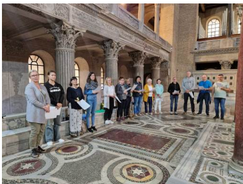
Župnijski pevski zbor – romarji ob oltarju nad grobom sv. Lovrenca v Rimu

izzivanje. Mašna obleka naj bo dostojna svetemu prostoru. Naj nam ne pride v navado, da je vse ustrezno in dobro (zlasti v poletnem času).